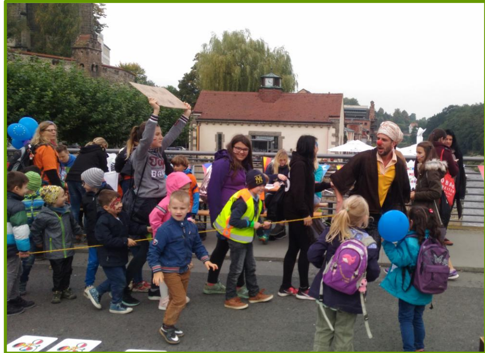
Besuch von den Clowns des Kulturbrücken e. V.